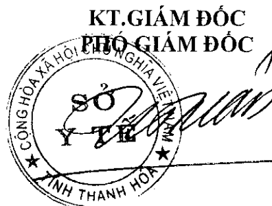
Nguyễn Bá Cẩn